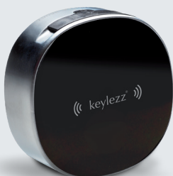
Keylezz® Turn „RFID“