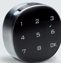
Keylezz® Turn „PIN“