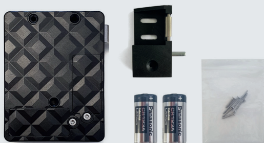
Keylezz® Fallenschloss mit Zubehör