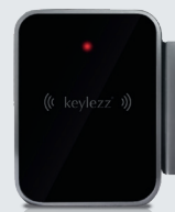
Keylezz® Außenantenne mit LED-Anzeige und Notbestromung